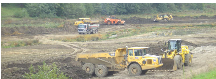
L'enlèvement de 15 000 m 3 de limons au lac : un travail considérable mené sur plus de deux mois et demi.

Après les importants travaux de sécurité et d'entretien effectués sur le lac (second déversoir et enlèvement des limons), le Conseil a décidé l'aménagement d'un sentier cheminant le long du lac, côté route de Saint-Antoine. Une subvention a été demandée auprès du CDDRA à ce sujet. Ces travaux seront réalisés en tout début d'année 2013, juste avant la remise en eau du lac prévue courant février 2013.