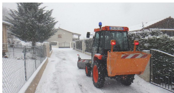
Déneigement avec le nouveau mini-tracteur communal équipé d'une lame et d'une saleuse auto-chargeuse lors de l'épisode neigeux du début décembre 2012.

Le Conseil a validé le renouvellement des annonces pour la voiture publicitaire auprès de la société Info-Com, pour la troisième reprise et pour 2 ans, soit 6 ans au total. Une réception sera organisée au printemps pour remercier toutes les sociétés ayant contribué au financement du véhicule par la pose d'annonces publicitaires depuis le début de l'opération. Un Agenda 2013 a été commandé auprès de la même société (Info-Com). Il est également financé par des annonces publicitaires et sera distribué auprès de tous les habitants de la Commune.